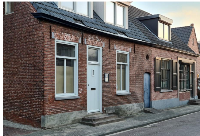
Huidig huizen aan de Hogestraat 11(links) en 13 (rechts)

Op de locatie Hogestraat 11 en 13 heeft niet altijd een huis gestaan. Voorheen was dit een moestuin welke behoorde bij het voormalige huis van Petrus Amiot, huidig adres Sint Bavostraat 90. Die moestuin was 8.980 m 2 groot en liep vanaf het huis helemaal door naar waar nu het Kennedyplein is en grensde ook aan de huidige Hogestraat. In die moestuin is op de huidige locaties Hogestraat 11 en 13 in het midden van de 19 e eeuw een huis gebouwd welke later weer afgebroken is. Later zijn daar weer nieuwe huizen gebouwd. Beiden panden zijn recentelijk verkocht en daarmee werd Floris Voesenek de eigenaar van de woning aan de Hogestraat 11 en de familie Weijgers van Hogestraat 13.