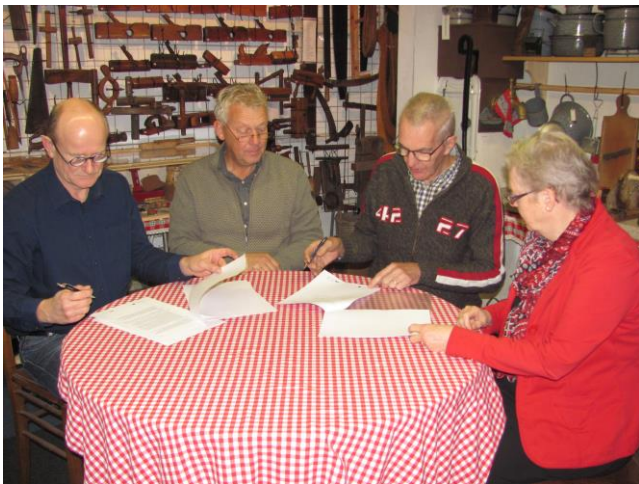
Ondertekening overeenkomst

Op 1 november 2017 hebben de voorzitters en de secretarissen van Stichting Boerendag en Heemkundekring De Drie Heerlijkheden hun handtekening gezet onder een overeenkomst, waarin met elkaar afgesproken is dat de Heemkundekring zich kan vestigen in de nog te bouwen langgevelboerderij bij "De Karkooi" aan de Tiggeltsebergstraat te Rijsbergen.